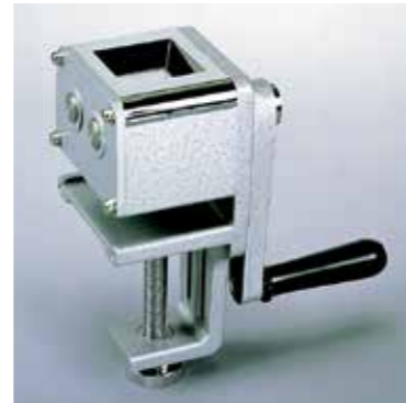
Мельница для измельчения образцов