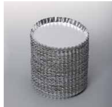
Одноразовые алюминиевые чашки