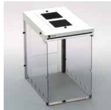
Ветрозащита с дезодорирующим фильтром FW-100