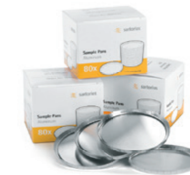
Одноразовые подложки для проб